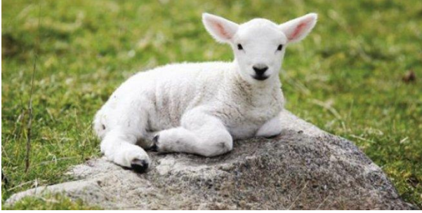
Resim 1: Kuzu

Not: %1 önem düzeyinde istatistiki olarak anlamlılık * işareti ile gösterilmiştir. (Times New Roman 10 punto italik)