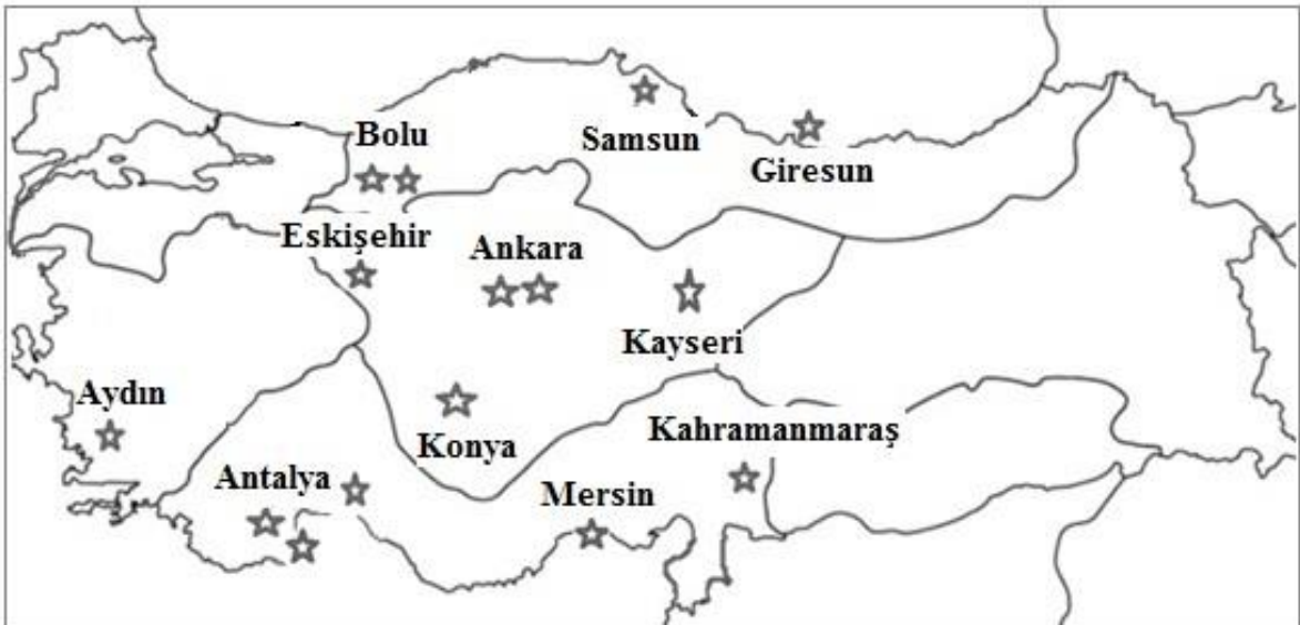
Şekil 1. B grubu ruhsatlı Hayvanat bahçeleri ve akvaryumların (☆) Türkiye'deki dağılımları.

Türkiye'de, 06.08.2014 tarihine kadar B grubu ruhsata sahip 15 Hayvanat Bahçesi ve Akvaryumun kurulduğu tespit edilmiştir [9]. Bunlardan hiçbirisi kapatılmamıştır. Akdeniz Bölgesi'nde ve İç Anadolu Bölgesi'nde 5'er, Karadeniz Bölgesi'nde 4, Ege Bölgesi'nde de ise 1 adet Hayvanat Bahçesi açılmıştır (Şekil 1).