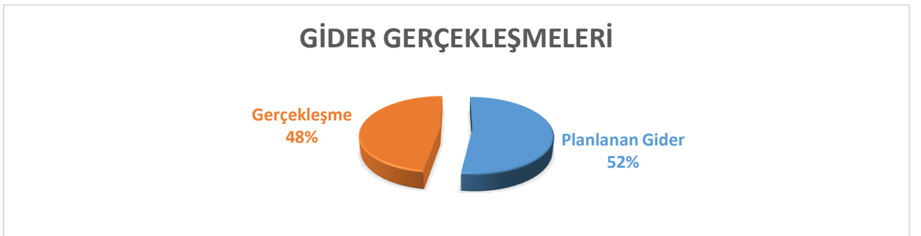
Grafik 4: Gider Gerçekleşmeleri Grafiği