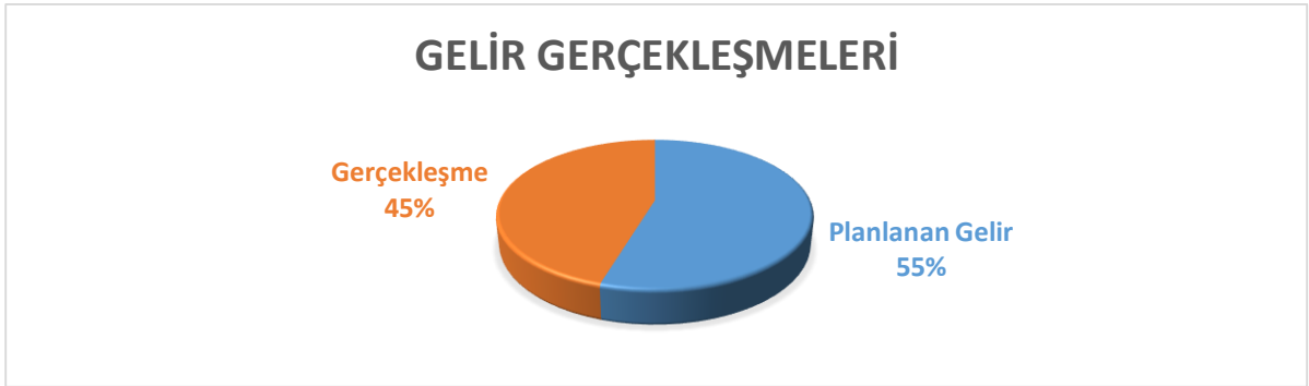
Grafik 3: Gelir Gerçekleşmeleri Grafiği

Özel Bütçeli İdare olan Dumlupınar Üniversitesi giderlerini, öz gelirleri ve hazine yardımları ile karşılarken kamu kaynaklarının etkili, ekonomik ve verimli kullanılması ilkesiyle hareket etmektedir.