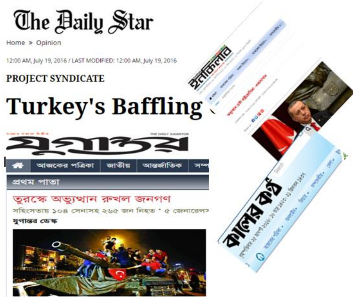
Resim: The Daily Star, Jugantar, Daily Inqilab and Kalerkantho

Yayınlanan dört büyük günlük gazetenin 16 Temmuz 2016'da nasıl kitlelerin darbe girişimini engelledikleri yukarıda gösterilmiştir.