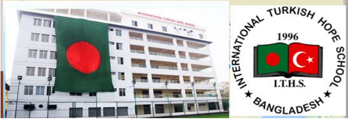
Resim: Uluslararası Türk Umut Okulu (Gülen'e bağlı bir okul) ve amblem

Uluslararası Türk Umut Okulu olarak isimlendirilen Bangladeş'teki Gülen okulu Bangladeş, Dhaka da yer alan Türk çalışanlar tarafından yönetilen bir okuldur. Okul 1996'da ilk kez öğrenci aldı ve resmi olarak 1997'de Türkiye Cumhuriyeti'nin eski Cumhurbaşkanı Süleyman Demirel tarafından açıldı.