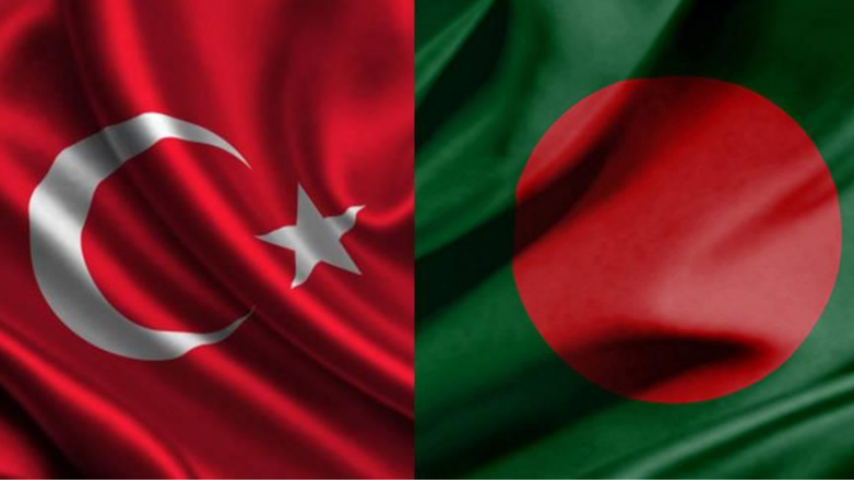
Resim: Türkiye ve Bangladeş Bayrağı

Bangladeş, dünyada 3.büyük Müslüman nüfuslu, bir Güney Asya ülkesidir. Ve Türkiye, Orta Doğuda etkili bir Avrasya ülkesidir. Daha öncede belirtildiği gibi iki ülke hem muhteşem bir tarihe hem de iyi ilişkilere sahip ülkelerdir; fakat bugünlerde ikisi arasındaki ilişkiler sosyo-ekonomik ve siyasi anlamda umulan bir seviyede değildir.