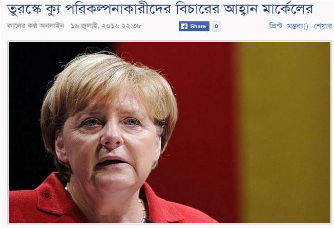
Resim: Alman Şansölye Angela Merkel

Kalerkantho ayrıca Hindistan vatandaşlarının Türkiye'ye gitmemelerini ve Türkiye'de kalanlarında ikamet edenlerin yerlerinden ayrılmamaları konusunda uyarın Hindistan Dış İşleri Bakanı Sushma Swaraj gibi yerel tepkilere de yer verdi. Ayrıca vatandaşlarından Türkiye'deki Hindistan büyükelçiliğiyle iletişimlerini sürdürmelerini istedi. Ayrıca özel bir yardım hattı vatandaşlarına sunuldu. 26