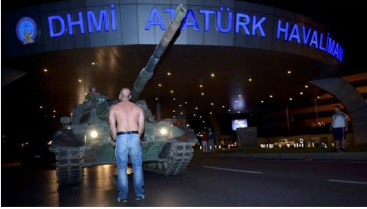
Resim: Askeri Tankın Önünde Duran Bir Adam

Jugantar gazetesesi hükümetin yanında yer alan darbe girişimi karşıtı söylemlerden bahsetmiştir. Milliyetçi Hareket Partisi (MHP) Başkanı Devlet Bahçeli'nin, Türkiye Başbakanı Binali Yıldırım'ı telefonla aramasına özel önem verildi. Devlet Bahçeli partisinin halkla birlikte olduğunu milletine bildirdi: “Eğer demokrasi ve millet birliği çöküntüye uğrarsa iç savaş başlayabilir.” Halkların Demokratik Partisi (HDP) liderleri de “Hiç kimse insanların kabul ettiği bir gücü görmezden gelemeyiz.” açıklamasını yaptı 19 .