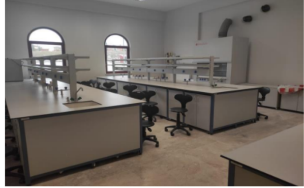
Görsel 4. Fizik laboratuvarından görüntüler