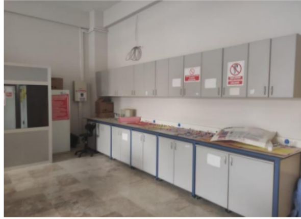
Görsel 3. Biyoloji laboratuvarından görüntüler