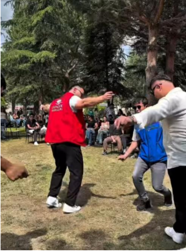
EK.3 (Kant 3)