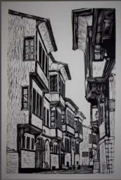
Abdulmatin SİYAM, Germiyun Sokakı, 33x50 cm, 2019, TURKEY