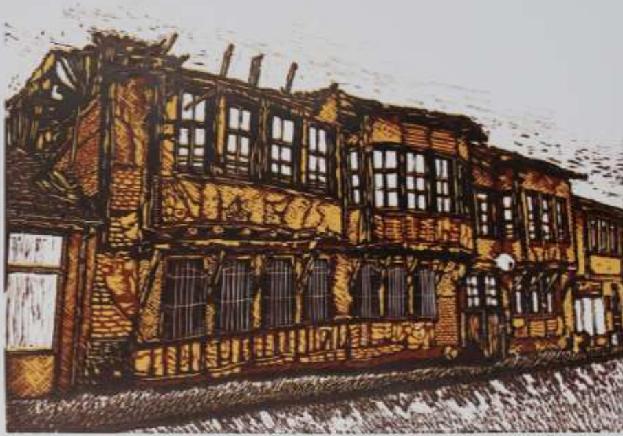
1. The drawing shows a half-timbered building with a damaged roof and a street in front.