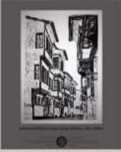
Abdulmetin Siyam, Germiyan Sokağı, 35x50 cm, 2019, TÜRKİYE