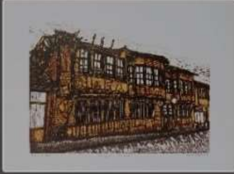
Ekrem Özgün, Kütahya'da Tarihi Bir Konak, 50x70 cm, 2017, TÜRKİYE