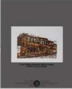
Ekrem Özgün, Kütahya'da Tarihi Bir Konak, 50x70 cm, 2017, TÜRKİYE