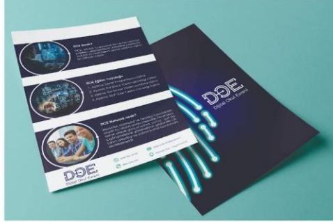
El İlanı Tasarımı