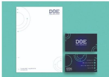
Kurumsal Kimlik (Kartvizit - Antetli Kağıt)