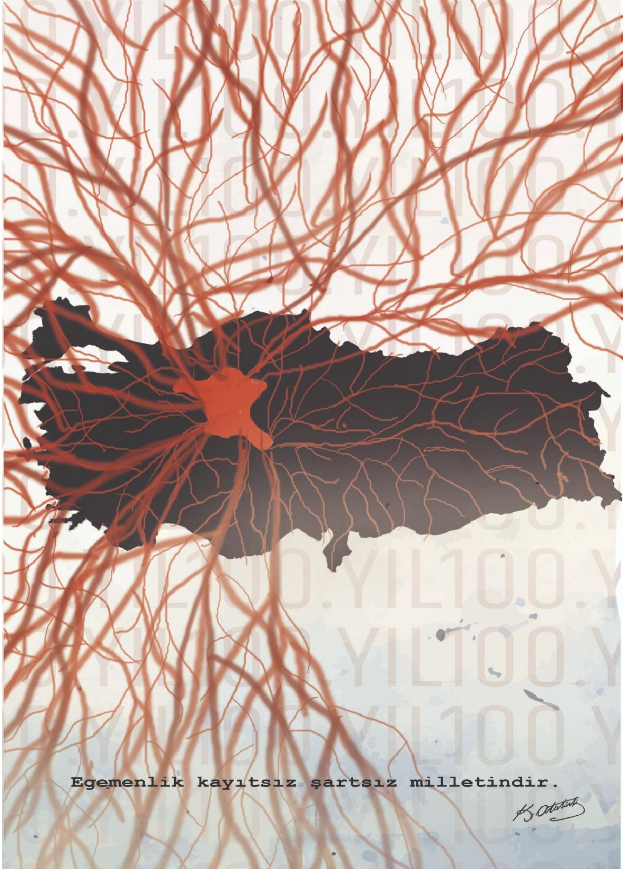
SERGİLEME ÖDÜLÜ- HALİME ALADAĞ (LİSANS 4. SINIF )