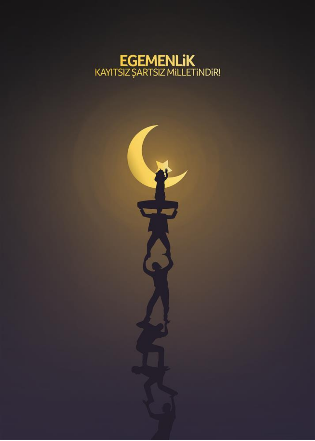
BAŞARI ÖDÜLÜ- MERT BAĞÇİÇEK (LİSANS- 3 SINIF)