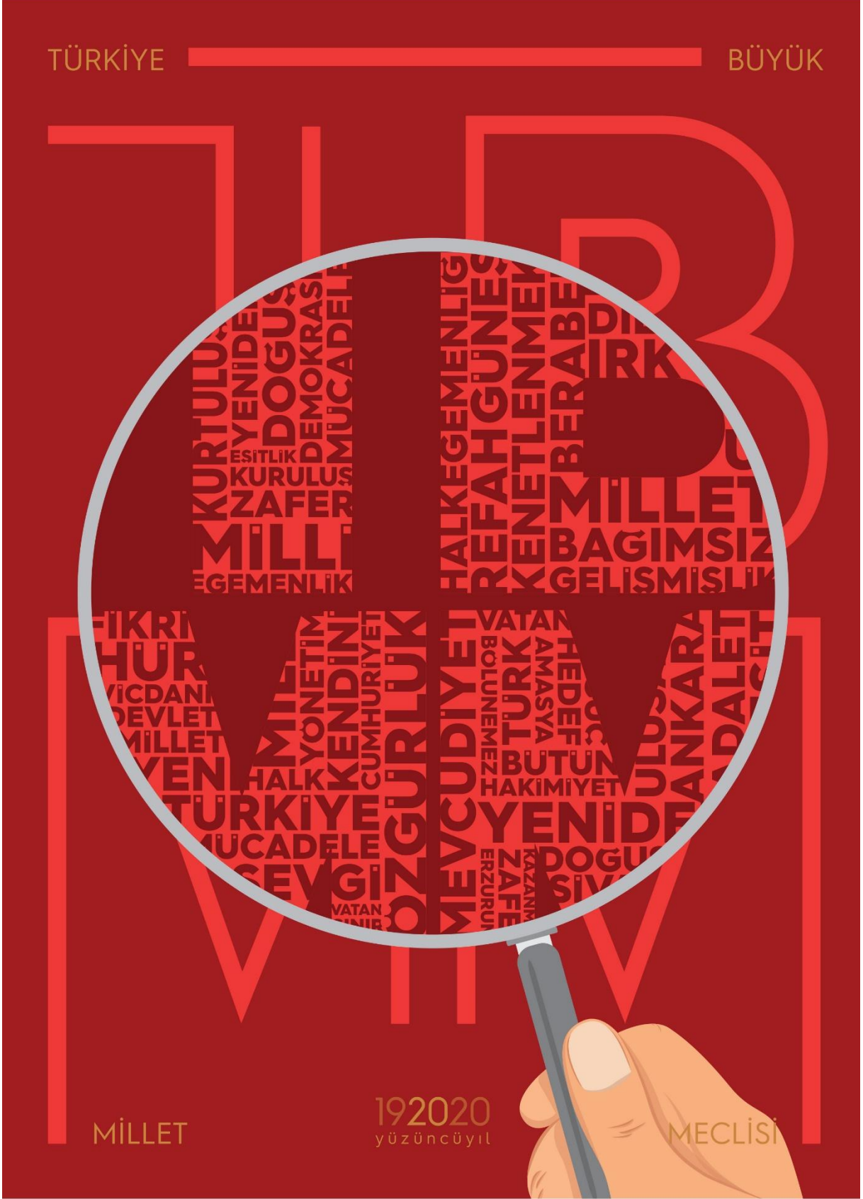
SERGİLEME ÖDÜLÜ- ZEYNEP ADATEPE (LİSANS 4. SINIF )